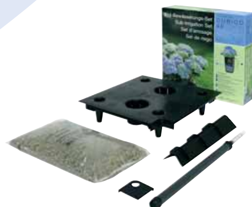
Sub-irrigation set Bewässerungs-Set