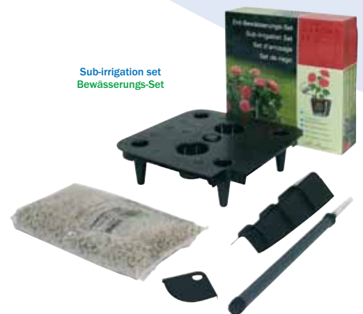
Sub-irrigation set Bewässerungs-Set