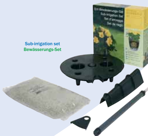
Sub-irrigation set Bewässerungs-Set